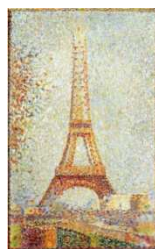
La Tour Eiffel, 1889