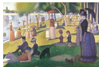
Un dimanche après-midi sur l'île de la Grande Jatte, 1884-1886