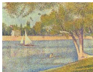
La Seine à la Grande Jatte, 1888